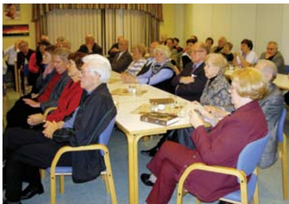
Fjöldi eldri borgara sækir hið fjölbreytta starf sem hinar ýmsu nefndir standa fyrir innan Félags eldri borgara í Kópavogi