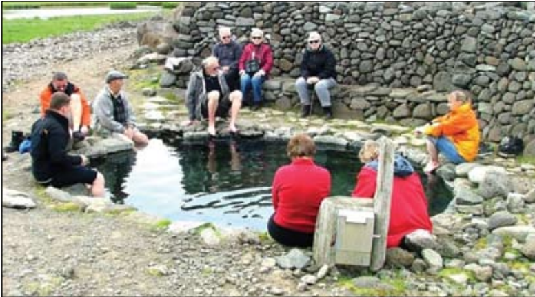
Félagar í ferðanefnd FEBK í Grettislaug

stiklað á stóru varðandi störf nefndarinnar frá stofnun FEBK 26. nóvember 1988 til dagsins í dag