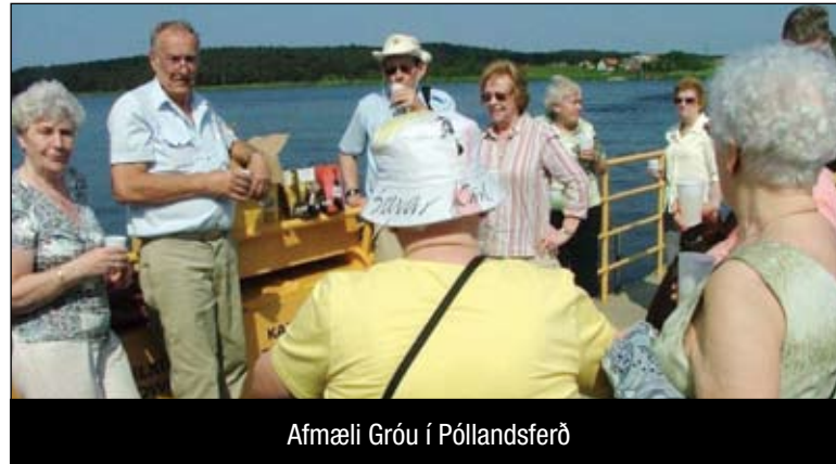
Afmæli Gróu í Póllandsferð

Ferðirnar hafa þótt ódýrar og vel heppnaðar og verið vel sóttar og hafa 500 til 600 manns ferðast árlega