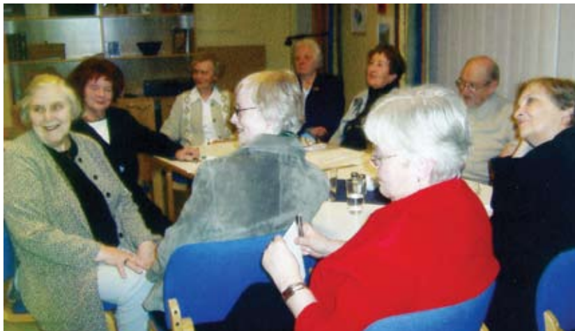
“Heimabrugg” er haldið einu sinni á ári í Gullsmára, þá koma félagar úr “Skapandi skrifum” í heimsókn til “Leshópsins” í Gullsmára.