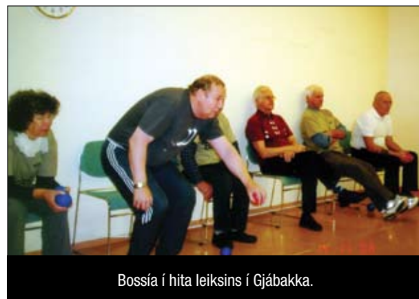
Bossía í hita leiksins í Gjábakka.

Samskipti hafa haldið áfram að eflast og má þar nefna að tengsl hafa myndast við Félag eldri borgara í Garðabæ. Öll starfsemi Bocciahópsins var í fyrstu undir félagsstarfi aldraða í Gjábakka og þátttaka í mótum og öðrum samskiptum undir merkjum þess. Þegar