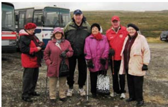
Áning! Mynd tekin úr einni af mörgum ferðum sem ferðanefnd FEBK stendur fyrir