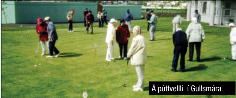
Á púttvelli í Gullsmára

Útivera og hreyfing er öllum holl, ekki hvað síst eldra fólki, en oft vantar einhvern hvata til að fá fólk til að hreyfa sig.