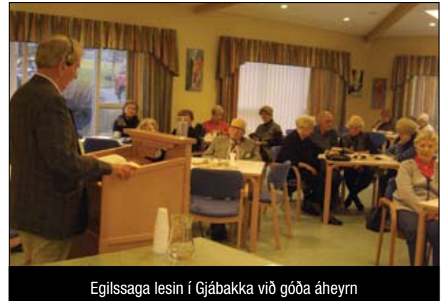
Egilssaga lesin í Gjábakka við góða áheyrn

Næsta vetur lásum við Njáls sögu og þá var farin ferð á söguslóðir næsta vor. Grettis saga var næst og einnig Hrafnkels saga. Síðastliðinn vetur hófst lesturinn seint vegna lasleika míns, en eftir áramót 2008 fórum við yfir Snorra-Eddu (Gylfagynningu) og frásagnir úr skáldskaparmálum. Núna erum við að lesa Egils