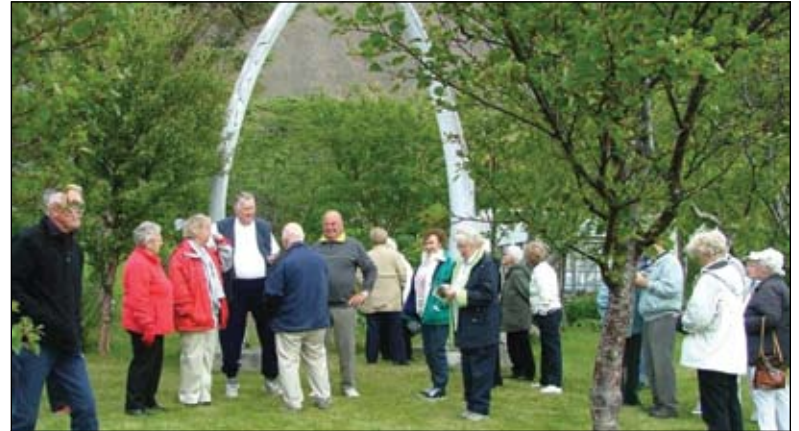
Skrúðgarður að Núpi í Dýrafirði